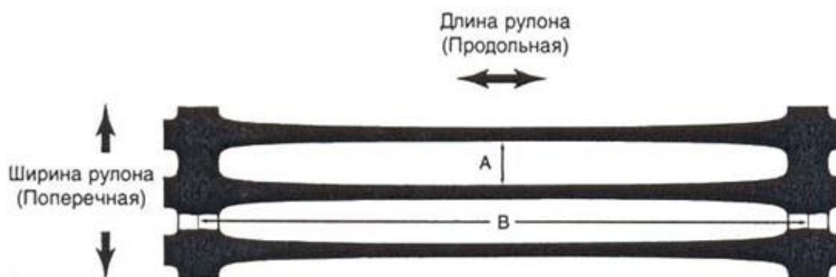
Рисунок А.2 Георешетка марки «ГРИДЕКС-К СО»